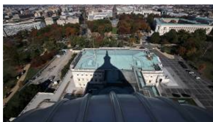
Amerikaanse economie raakt door Trump in 'boom-bustcyclus'