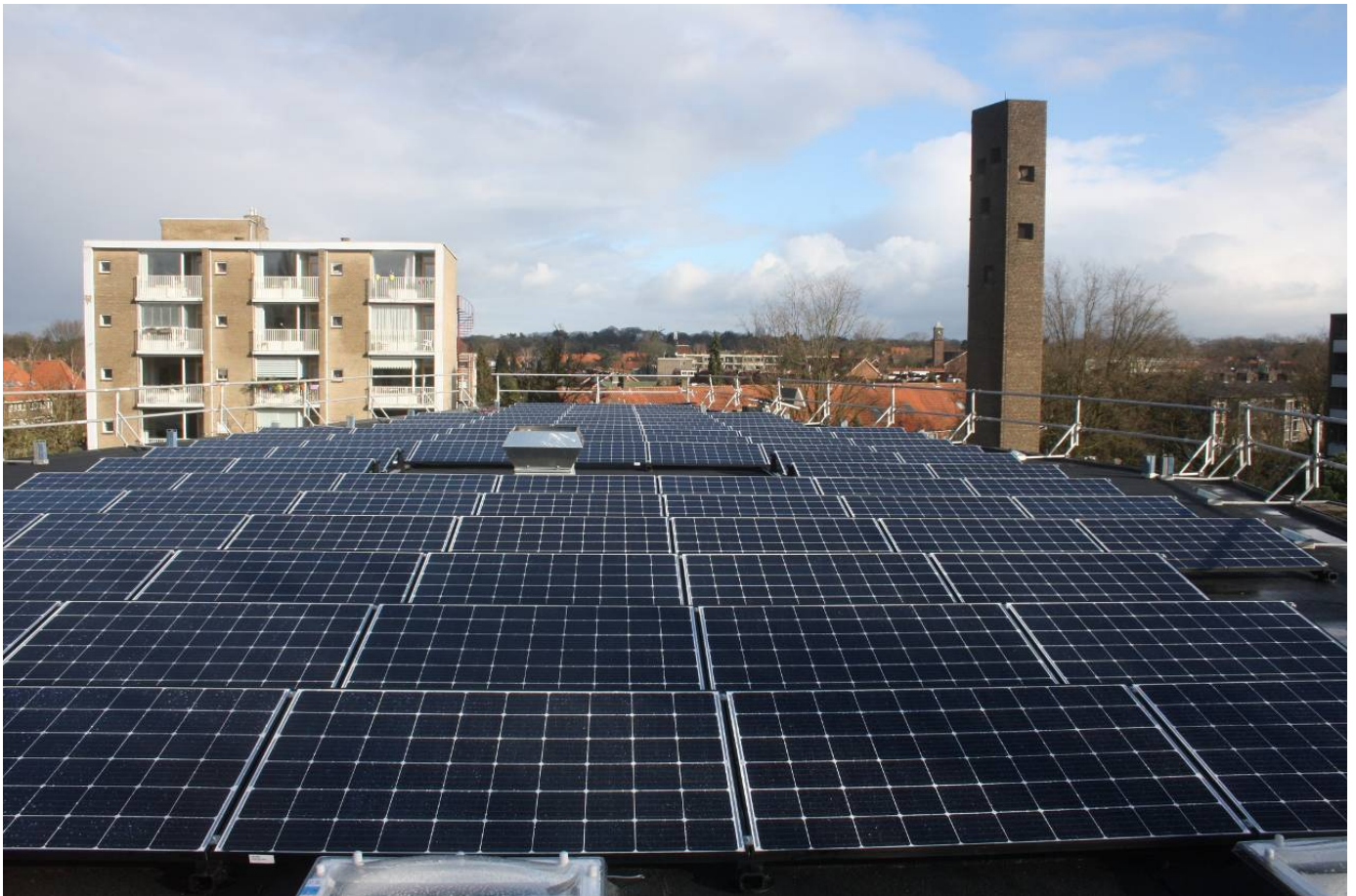
op de Bethlehemkerk in Hilversum heeft Hilverzon 99 zonnepanelen geplaatst.

Hilverzon wil groeien op zogeheten commerciële plekken, dus niet alleen op gebouwen van de gemeente. De coöperatie heeft met een tiental VvE's gesproken over 'verduurzaming van hun pand', schreef voorzitter Aernoud Olde eerder week in een brief van het bestuur, in aanloop naar de algemene ledenvergadering. Bij één VvE worden nu 147 panelen geplaatst. 'Maar door de structuur van VvE's blijkt het heel moeilijk om tot positieve besluitvorming te komen', schreef Olde.