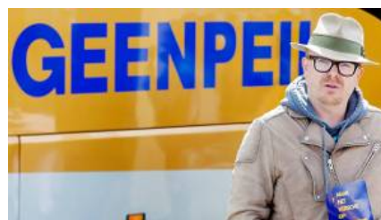
EU wil geld terugzien van GeenPeil