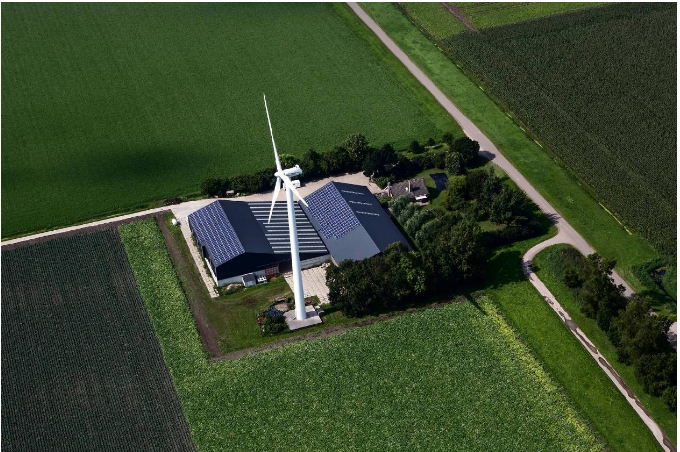
Boerderij met zonnepanelen en een windmolen. Lokale initiatieven zijn nu nog goed voor 2,5% van de zonne- en windenergie in Nederland.

Ondanks de groei blijft het lokale productievermogen bescheiden. Lokale energie is goed voor een capaciteit van 138 megawatt. Hier Opgewekt schat dat er op korte termijn nog eens een capaciteit 150 megawatt 'lokaal' bijkomt. Dat is dus een kleine 300 megawatt.