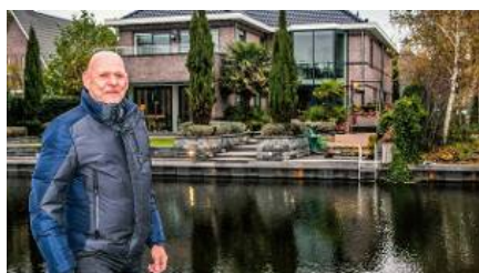
Strak huis aan Sneker water